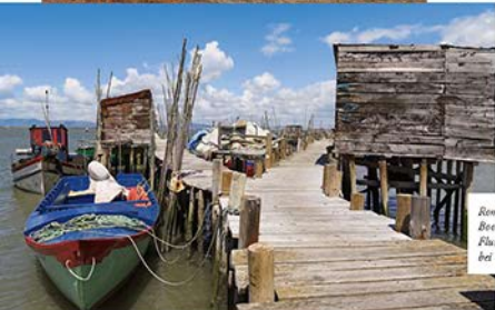
Romantisch: Bootszug am Fluss Sado bei Comporta

Küste ist der ja reichlich ungestüm, da zieht und zerrt er an den Stränden und peitscht sie mit Wellen, die irgendwo weit draußen Schwung holen und an- >