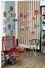
Im Reilmuseum gibt's einen biblischen Shop (oben) und ein Restaurant – die eigentlichen Gründe, warum man hierherkommt. Rechts: Die Endlosstrände von Comporta. Unten: Ferienvilla vom Feinsten – „3 Bliss“