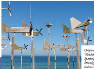
Originelle Windräder, die Spaziergänger aus Strandgut gebastelt haben (links o.). Unten: Die Landschaftskulisse des Hotels „Sublime“ ist sensationell, der Pool ein Traum